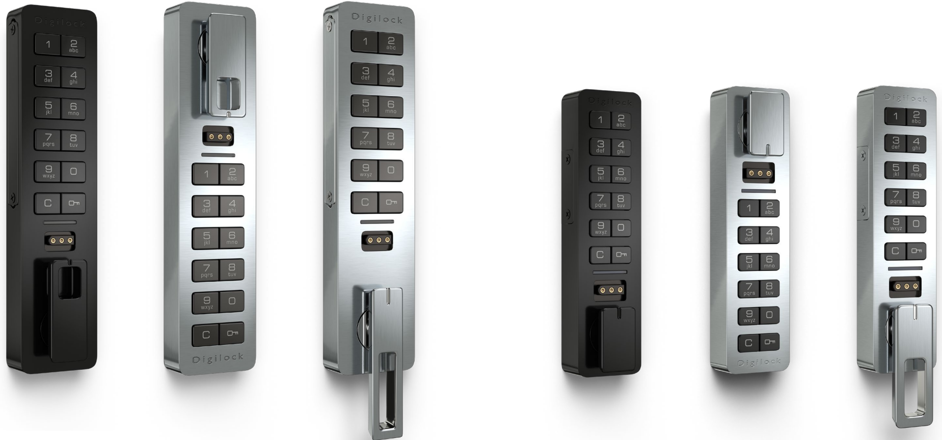
Standard-Vertikal Griff unten

Wählen Sie zwischen zwei eleganten Gehäuseformen in den Ausführungen Edelstahl Finish und schwarz